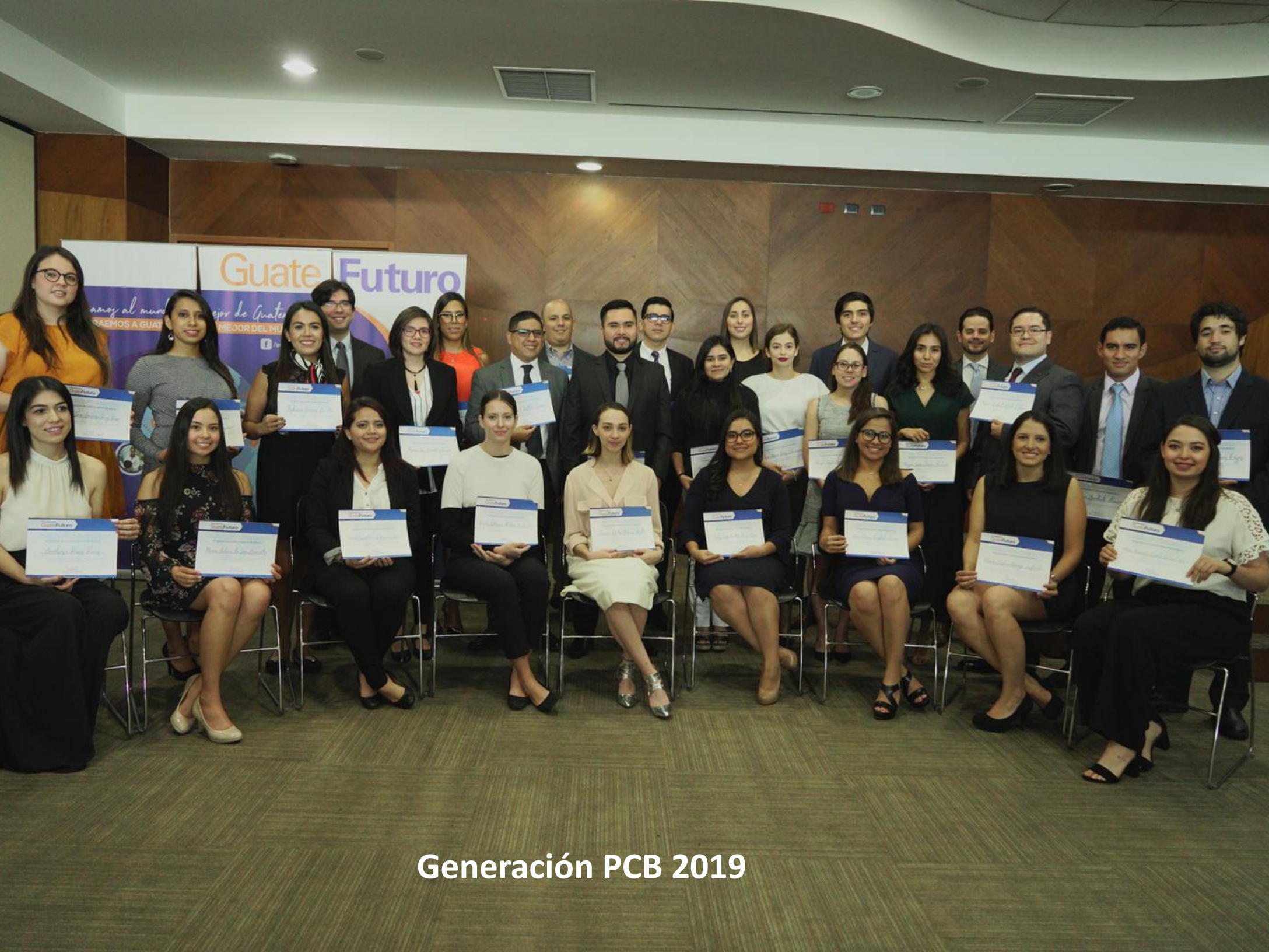
Generación PCB 2019